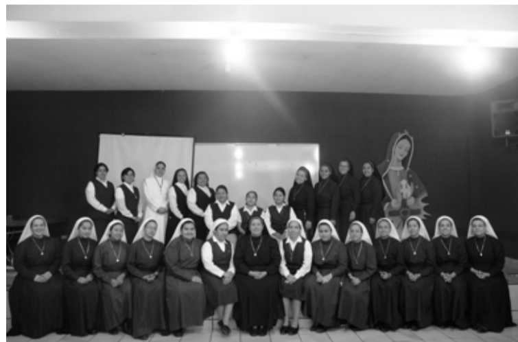
El 2 de febrero también se celebra la Jornada de la Vida Consagrada. Aquí religiosas de algunas de las congregaciones que realizan su apostolado en la Diócesis de Saltillo

El 2 de febrero de 1997 el Papa Juan Pablo II instituyó este día para realizar la Primera Jornada de la Vida Consagrada, y en su mensaje recalcó que el propósito era "ayudar a toda la Iglesia a valorar cada vez más el testimonio de quienes han elegido seguir a Cristo de cerca mediante la práctica de los consejos evangélicos