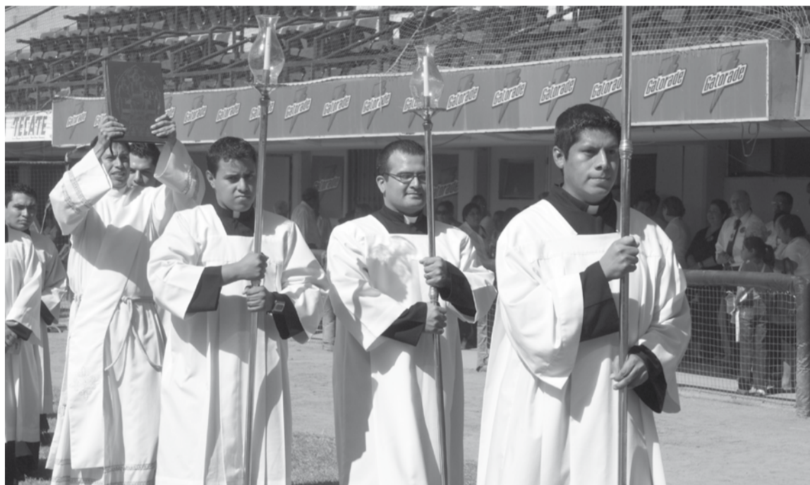
Una de las tareas de los seminaristas es el acolitado que realizan en las celebraciones diocesanas. Siempre presentes. Aquí en el inicio del Itinerario Guadalupano en Monclova, Coahuila el 23 de octubre del 2011