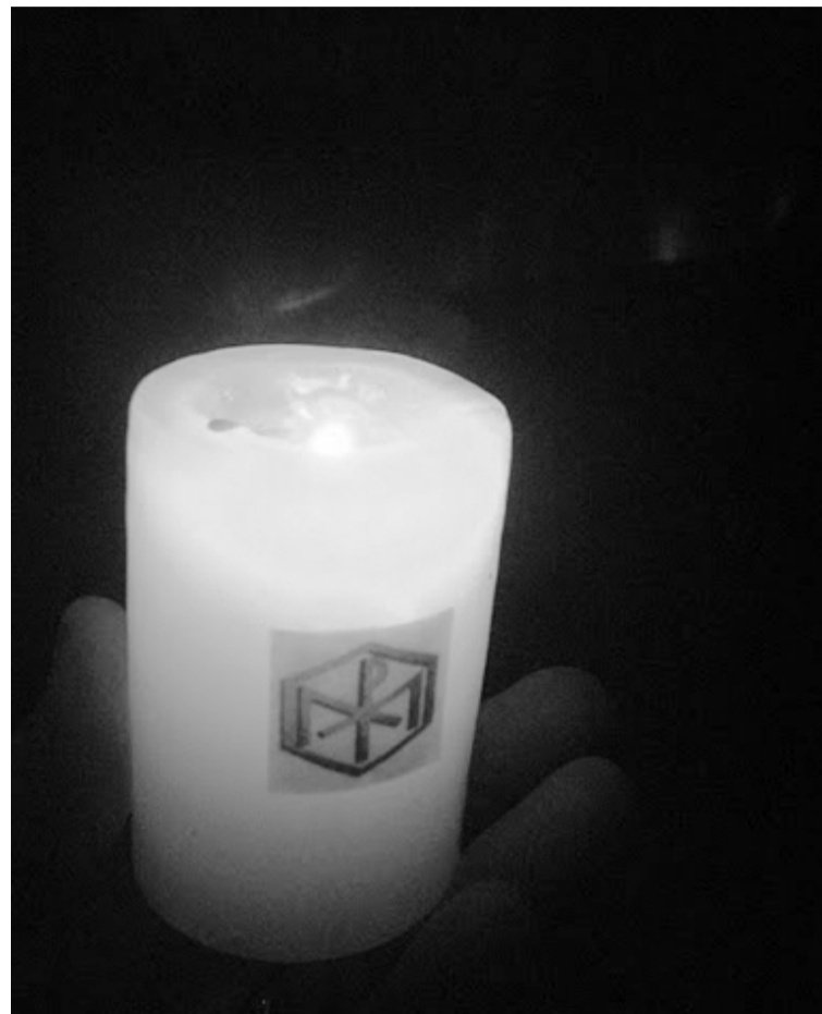
Jesucristo, luz de las naciones

Según el sitio de internet Wikipedia, la fiesta es conocida y celebrada con diversos